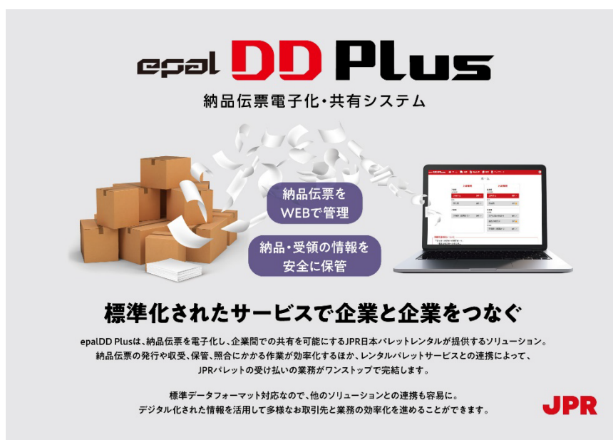
図：デジタル化された物流データの活用によるソリューションの例