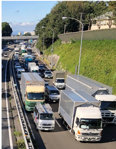
トラックの積載効率は40%未満にとどまっている(写真はイメージです)

トラックドライバーの深刻な人手不足への対策や、環境負荷の軽減が、社会的課題になっています。日本のトラックの積載効率は40%未満と言われており*その要因の一つは、長距離輸送における復路の空車輸送にあります。