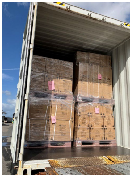
海上コンテナにパレット積みで積載