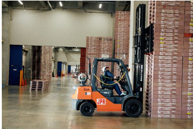
標準規格のレンタルパレットを企業間で共有することで一貫パレチゼーションを実現

パレットを企業間で共有して、リレーのバトンのように輸送に使用することで、物流の結節点で生じる人力による荷役作業を解消することを「一貫パレチゼーション」といいます。一貫パレチゼーションを行うためには、標準化されたパレットと共有のしくみが必要で、JPRは標準規格サイズパレットをレンタル方式によって企業に供給することによって一貫パレチゼーションを可能にしています。