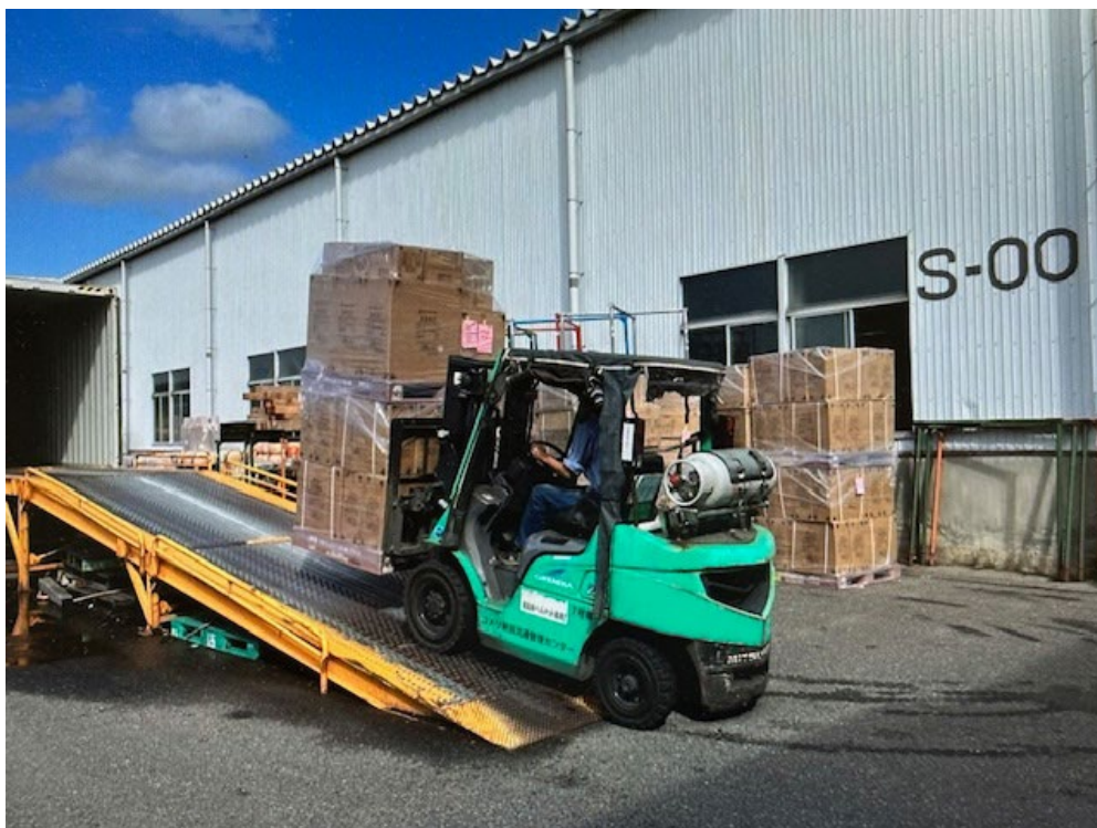
フォークリフトで荷役を効率化した

人手不足が深刻化している物流業界では、物流の結節点で生じる手荷役作業に起因する長時間労働や、過重な肉体的負担の解消が求められており、国も企業に対策を促しています。本件取り組みによる一貫パレチゼーションの導入は、海上コンテナへの積み込み時間を年間約 1,016 時間削減する効果が期待されるほか、従来発生していた木製パレットの廃棄にかかる環境負荷を軽減します。